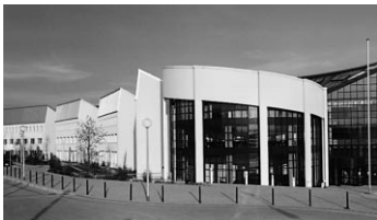
Hauptgebäude, Alfred-Herrhausen-Str. 50

Flughafen Dortmund; mit dem Taxi ca. 20 Minuten oder alternativ mit dem Flughafenbus bis Hbf Dortmund, von dort weiter mit der S-Bahn.