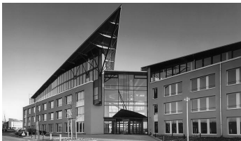
FEZ, Alfred-Herrhausen-Str. 44