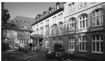
Annen, Stockumer Straße 10-12

Vom Hbf Witten aus mit der Buslinie 350 bis zur Haltestelle Rathaus, von dort weiter mit der Linie 371 bis zur Haltestelle Universität.